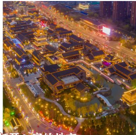
盐城，一个让人打开心扉的地方